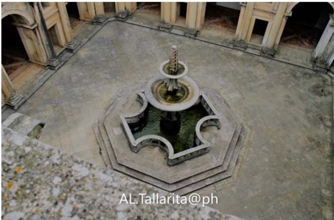
Figura 3 – Il Simbolo Che Racconta Il Potere.

che è il simbolo . Un'interpretazione dell'arte rupestre che la vede come segno di passate società, si può compiere attraverso una teoria generale dei segni atta a d'interpretare il segno stesso. La mancanza di concetti di facile interpretazione crea difficoltà di comprensione dei significati insiti nei materiali. Questo è ciò che avviene tramite la comprensione delle icone dell'arte rupestre, in quanto si determina un'incapacità di distinzione nitida delle qualità proprie dell'oggetto rappresentato.