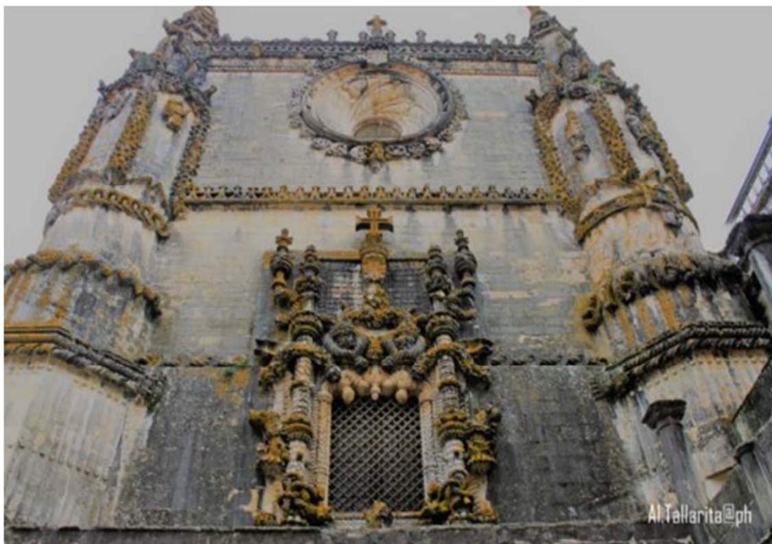
Figura 2 – Il segno che racchiude lo spazio.

In ogni situazione pratica agiscono: il segno , l' interpretante e l' oggetto tre elementi che fondano la Teoria dei Segni o Triade di Peirce per la quale una cosa che è rappresentata dal segno sta per