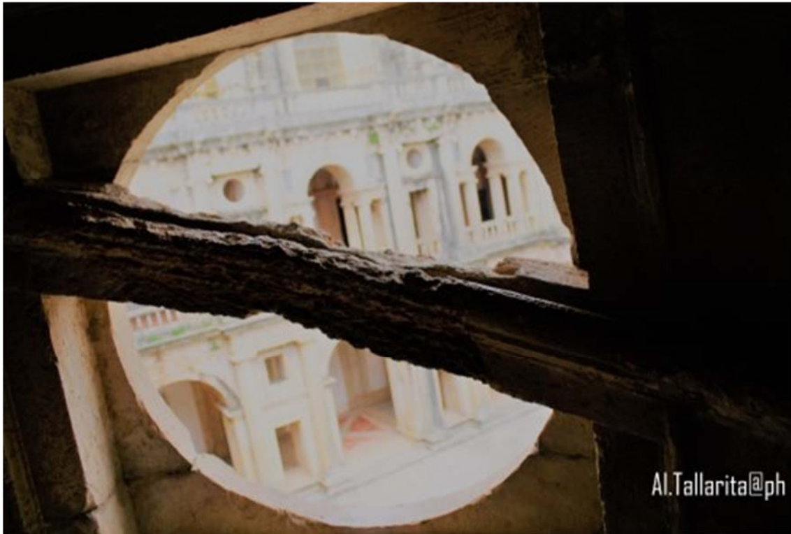
Figura 4 – Attraverso Il Segno.